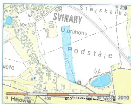
Zobrazení v grafickém prohlížeči

Parcelní číslo: 226/1 Obec: Hradec Králové [569810] Katastrální území: Svinary [760765] Číslo LV: 1152 Výměra [m 2 ]: 41191 Typ parcely: Parcela katastru nemovitostí Mapový list: DKM Určení výměry: Graficky nebo v digitalizované mapě Druh pozemku: orná půda